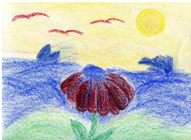
Dessin d'Anaïs Dumont, 3 ème année